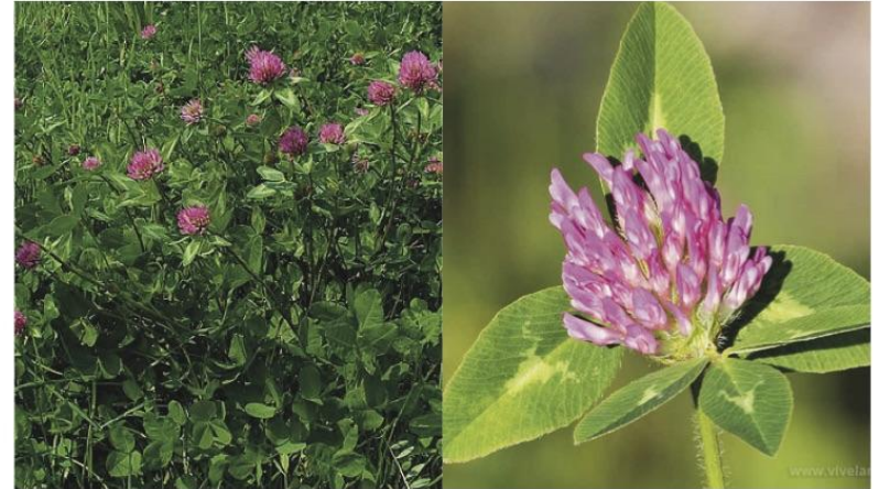
Trifolium pratense ●