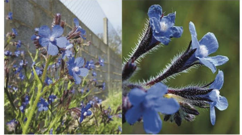
Anchusa azurea ●