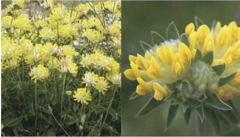
Anthyllis vulneraria ●