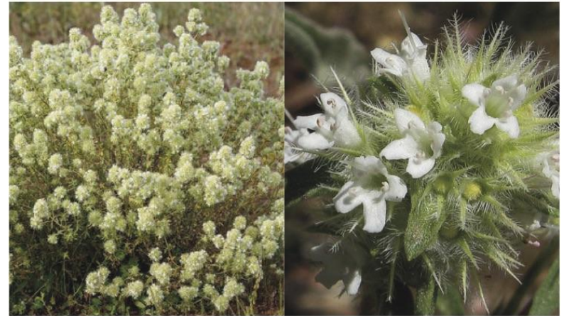
Thymus mastichina ●