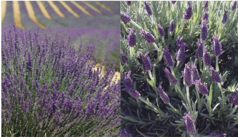
Lavandula stoechas ●